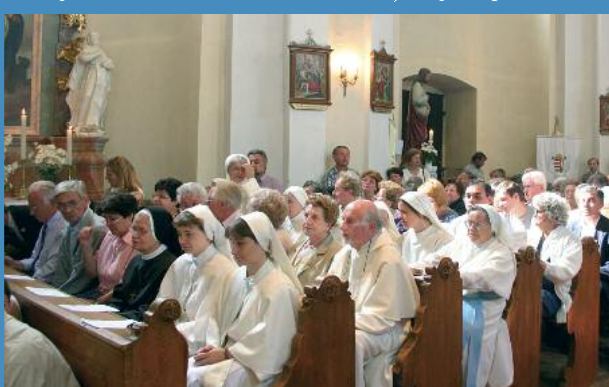
Keresztelő Szt János szentmise Zsámbékon

Norbert 1080 körül született az Észak-német - holland határ közelében Genep várurának fiaként. Mint fiatal ember előkelő származása révén Xanten város társaskáptalanjának tagja lett, ebből szép javadalmat húzott, de kanonoki kötelességét, a kórusima énekletét valószínűleg mással végeztette.