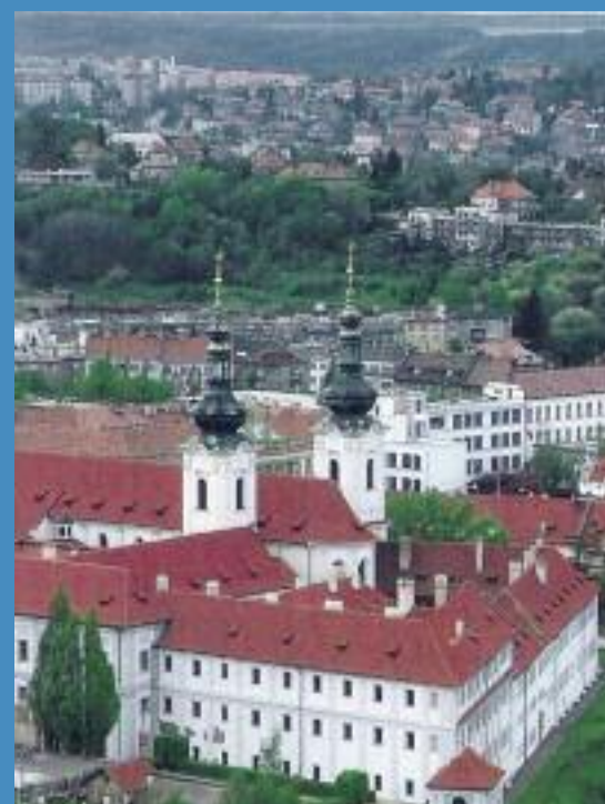
Strahov Premontrei apátság