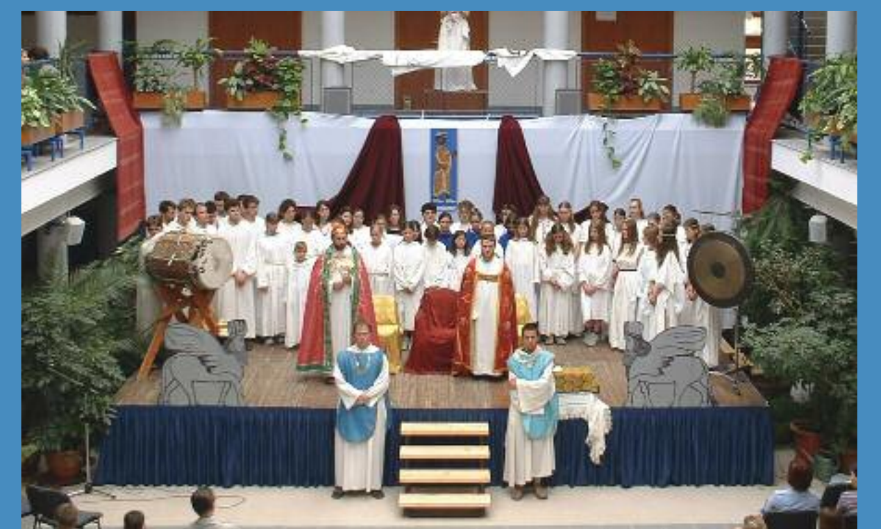
Dániel-játék a gödöllői Szt Norbert Gimnáziumban