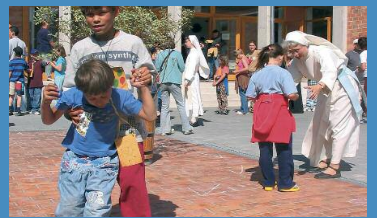
Zsámbéki Premontrei Szakiskola