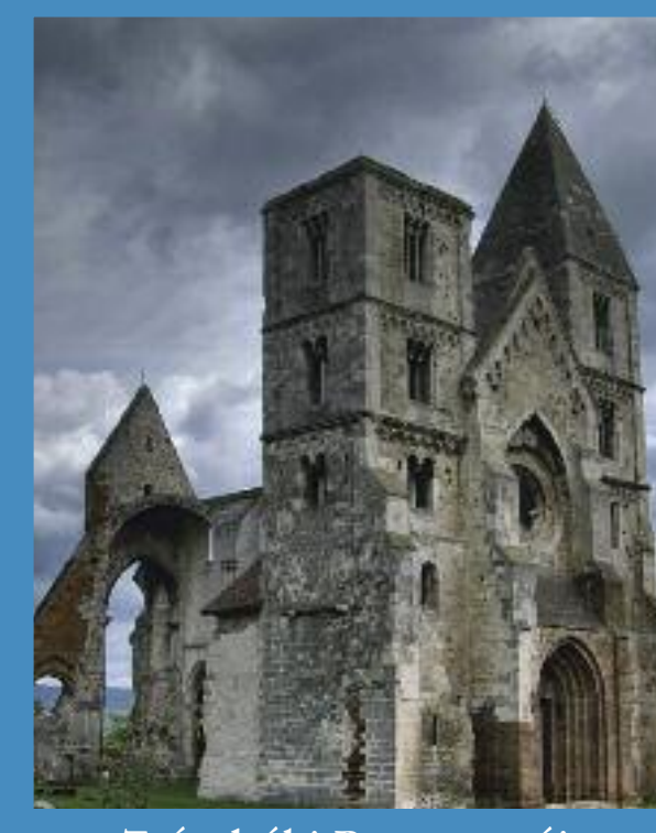
Zsámbéki Premontrei Prépostság

„Contemplata vivere et aliis tradere!” Vagyis: a liturgikus- és magánimából, a Szentírás olvasásából nyert tapasztalatok szerint szeretnénk élni, és ugyanezen kincsek által szeretnénk éltetni mindazokat, akikkel egy településen élünk.