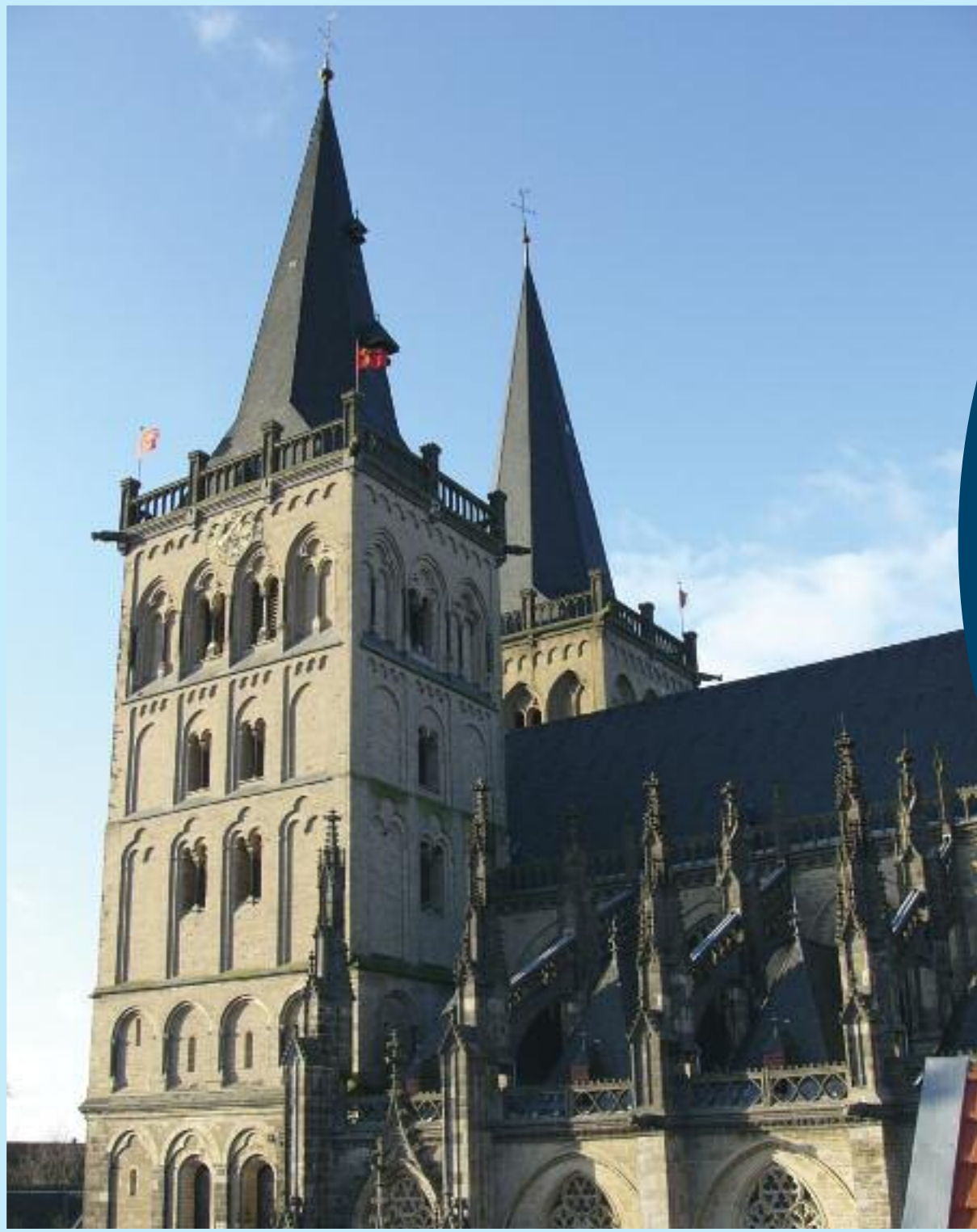
Szt Viktor Székesegyház- Xanten,