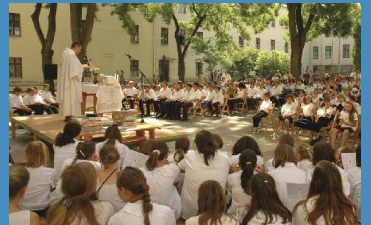
Évzáró a zsámbéki Keresztelő Szt János iskolában