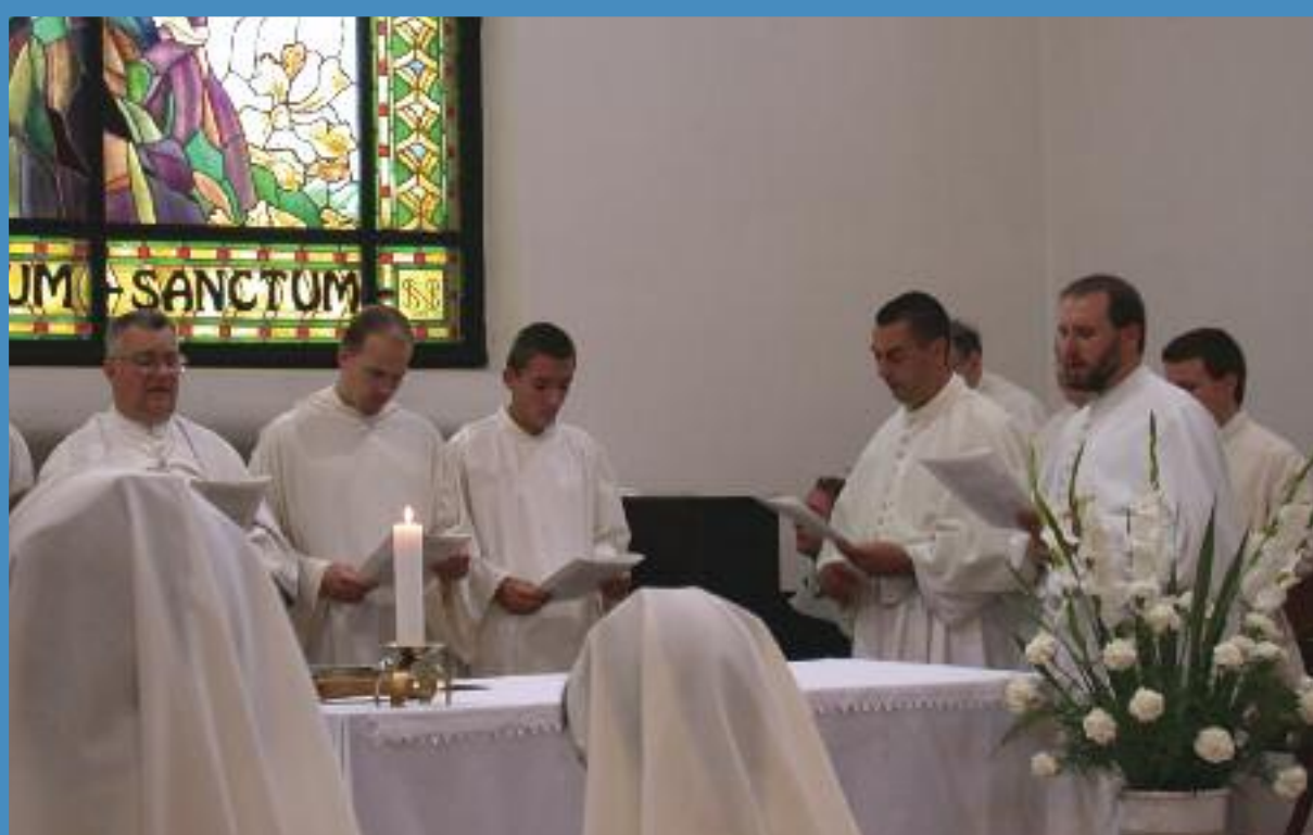
Fogadalom a Gödöllői Premontrei Perjelség templomában